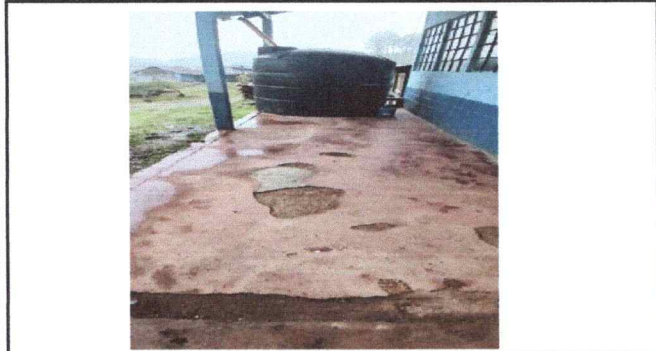
Foto 3: PISO DE CORREDOR EN MAL ESTADO Y FALTA DE BASES DE TINACOS Y TUBERIAS