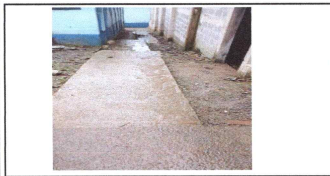
Foto 5: FALTA DE ENTORTADO EN ENCAMINAMIENTOS DE BAÑOS HACIA LAS AULAS